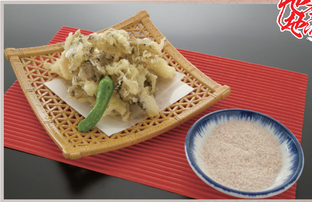
スタッフおすすめ！地元名産 藻塩と共に まいたけの天ぷら