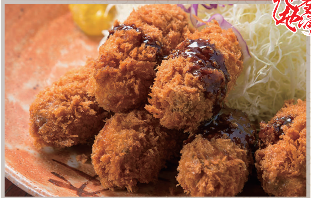
広島倉橋島産 カキフライ