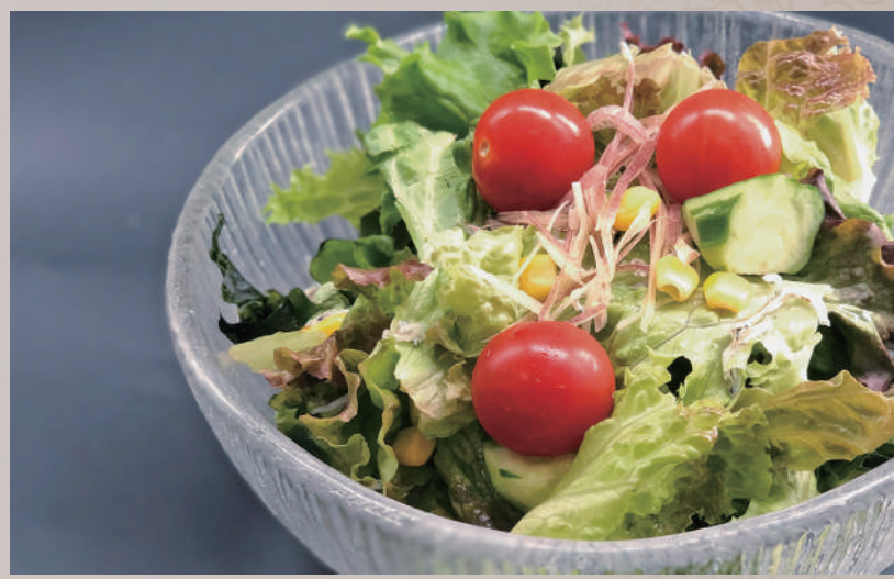
シェフの気まぐれサラダ